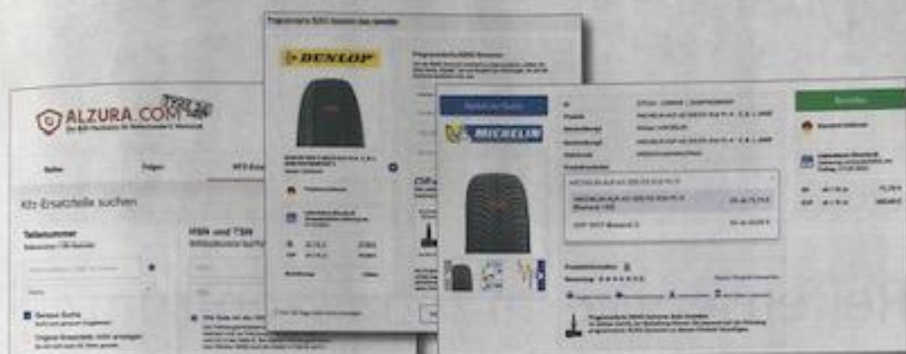
Suchfunktionen und Anzeigedetails auf Alzura Tyre24 wurden für einfachere Vergleichbarkeit und schnellere Ergebnisse überarbeitet.

trierten sich neue Lieferanten über das Formular, werden sie automatisch freigeschaltet und können sich direkt einloggen. Sobald der Lieferant alle für den Verkauf wichtigen Daten vollständig zur Verfügung gestellt hat, ist dieser auch berechtigt, seine Ware auf der Plattform zu verkaufen.